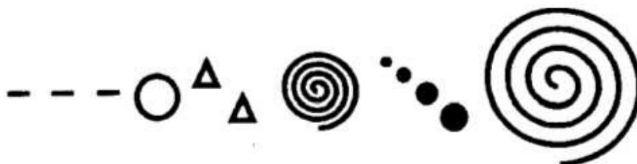
Образец графической партитуры

Различные графические партитуры могут быть предложены в качестве вариантов. Любое звуковое воплощение их будет правильным, так как в этом задании важно развивать воображение и ассоциативное мышление.